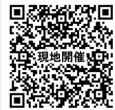
現地開催にあたっての注意事項