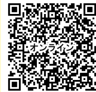
オンライン開催にあたっての注意事項