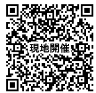
現地開催にあたっての注意事項