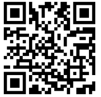
講座受付フォーム

※受講をキャンセルされる場合は、Eメールにてご連絡ください（mail: kouza@shiraume.ac.jp ）。