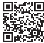
講座受付フォーム