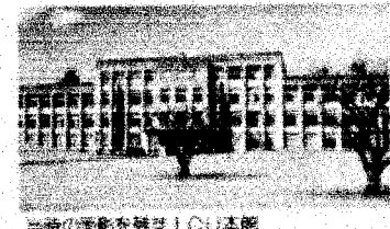
当時の面影を残すICU本館